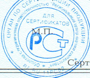
Схема сертификации 3, инспекционный контроль 1 раз в год.

Место нанесения знака соответствия – в товаросопроводительной документации, графическое изображение знака соответствия по ГОСТ Р 50460-92 с надписью «Добровольная сертификация».